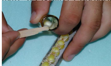
Φωτ. 9 Χρησιμοποιείτε μόνο ξύλινη σπάτουλα για την συλλογή του Β.Π. ποτέ μεταλλική.