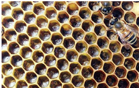
Εικόνα 4. Γόνος κατάλληλος για εμβολιασμό

Κάθε 6 ημέρες (δηλαδή κάθε δεύτερο εμβολιασμό) χρειάζεται η προσθήκη γόνου προκειμένου να διατηρηθεί το μελίσι για παραγωγή για μεγάλο χρονικό διάστημα. Έτσι από άλλα μελίσινα που διατηρούνται στο μελισσοκομείο αφαιρούνται 2 κηρήθρες με σφραγισμένο, εκκολαπτόμενο γόνο οι οποίες τοποθετούνται σε κάθε μελίσι παραγωγής βασιλικού πολτού.