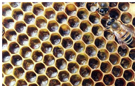
Εικόνα 4. Γόνος κατάλληλος για εμβολιασμό

Κάθε 6 ημέρες (δηλαδή κάθε δεύτερο εμβολιασμό) χρειάζεται η προσθήκη γόνου προκειμένου να διατηρηθεί το μελίσι για παραγωγή για μεγάλο χρονικό διάστημα. Έτσι από άλλα μελίσινα που διατηρούνται στο μελισσοκομείο αφαιρούνται 2 κηρήθρες με σφραγισμένο, εκκολαπτόμενο γόνο οι οποίες τοποθετούνται σε κάθε μελίσι παραγωγής βασιλικού πολτού.